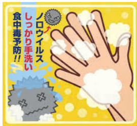
ノロウイルスの感染経路