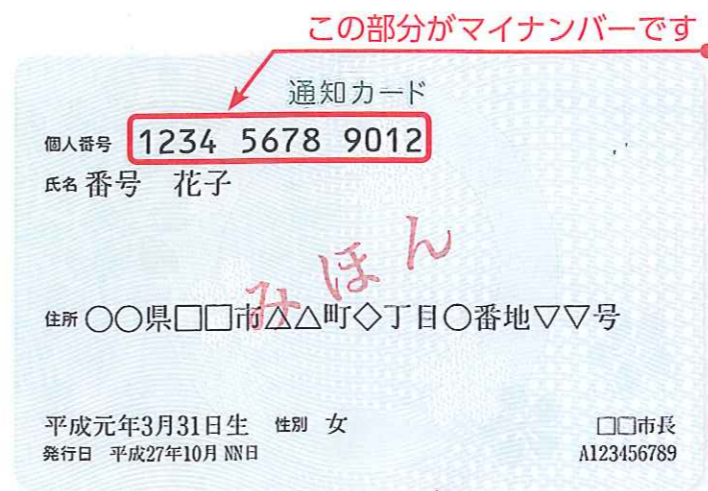
この部分がマイナンバーです