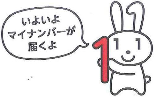
マイナンバーキャラクター「マイナちゃん」

マイナンバーは大切に保管を マイナンバーは、平成28年1月以降、法律で定められた税・社会保障・災害対策分野で、申請など各種手続きの際に、記載を求められる場合があります。 勤めている人(パート、アルバイトを含む)は、源泉徴収票や社会保険などの書類作成のため、事業主からマイナンバーの提供を求められます。事業者には厳格な個人情報保護が義務付けられます。マイナンバーは、原則として一生変わりません。大切に保管してください。